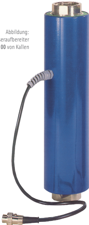
Abbildung: Der Wasseraufbereiter KSE 100 von Kallen